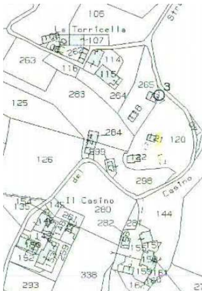
Stralcio di mappa catastale