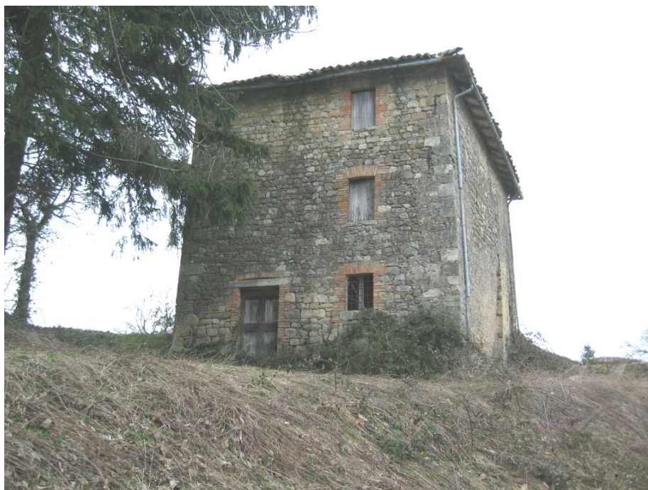
Foto n. 75 Torricella. Edificio in prossimità della torre