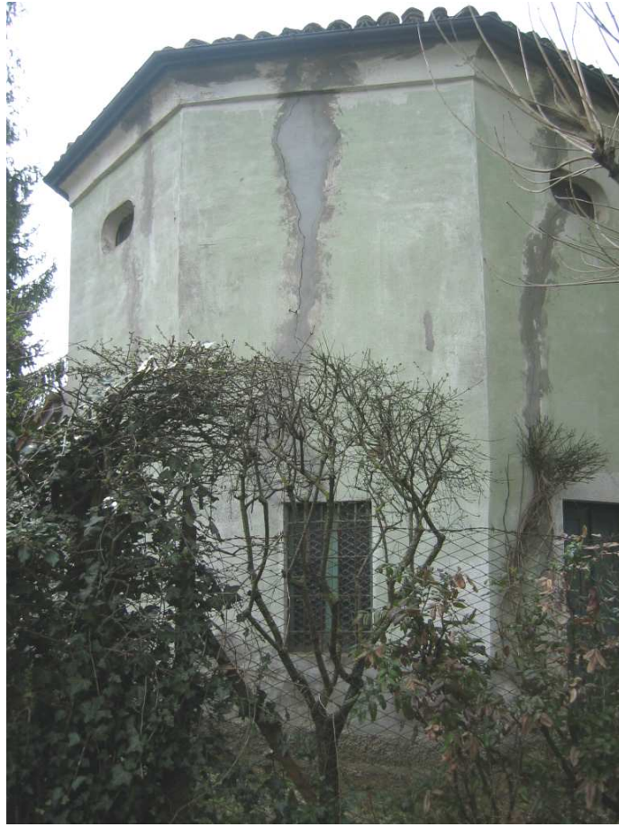
Foto n. 27: Il Casino. Oratorio settecentesco a pianta semiottagonale