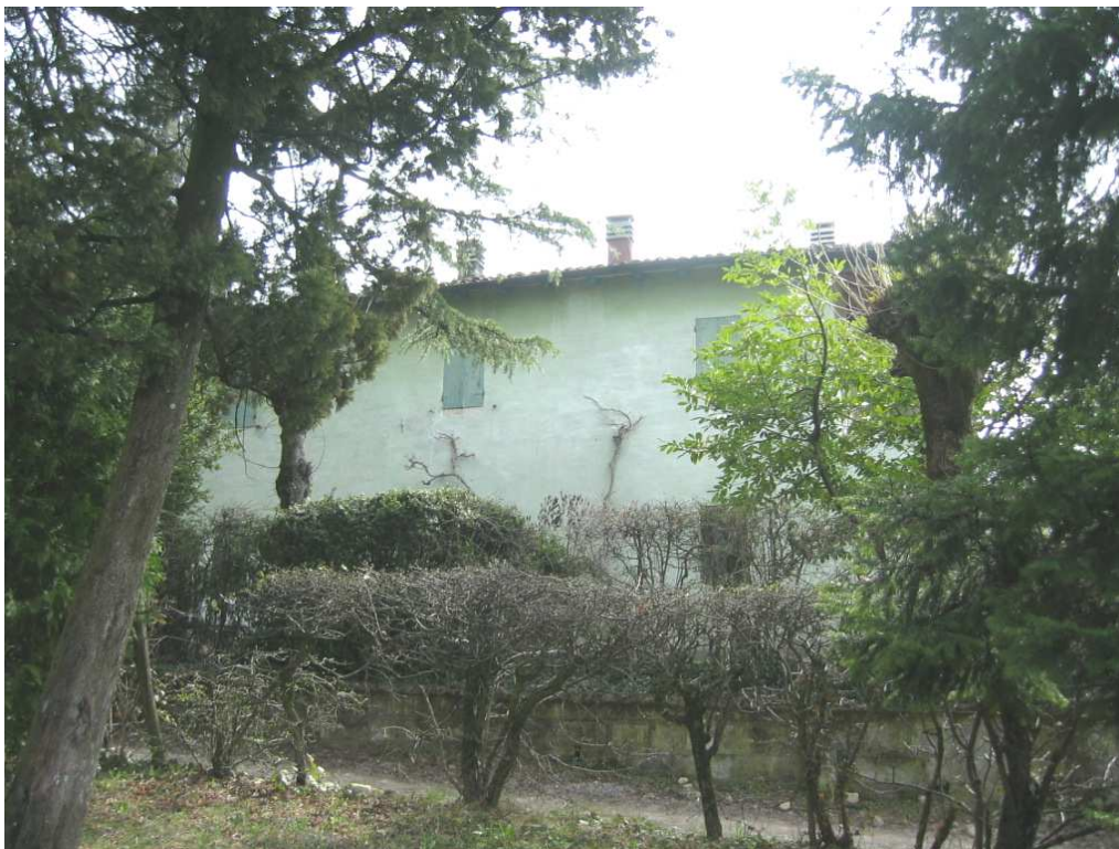
Foto n. 58: La cornice di piante sempreverdi caratterizza questi insediamenti